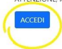
Figura 1 - Accesso al sistema

ATTENZIONE, leggere attentamente queste linee guida prima di effettuare il login: Manuale.pdf