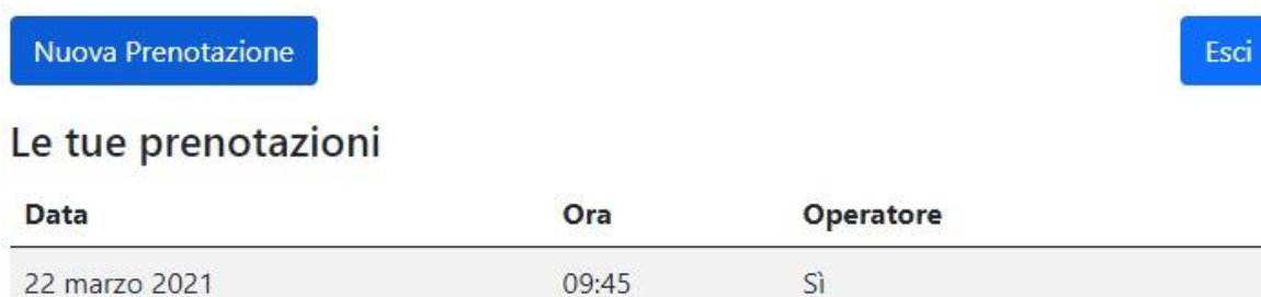
Figura 6 – Lista delle Prenotazioni

In questa pagina l'utente vede tutte le prenotazioni che ha richiesto di cui deve ancora usufruire.