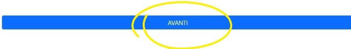
Figura 4 - Richiesta di prenotazione

File caricato: SERVIZIO HELP DESK - MODULO DI SEGNALAZIONE ERRORI.pdf