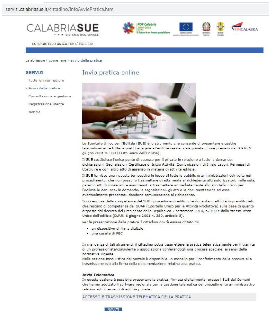
Figura 8 – Questa è la schermata in cui si trova l'utente dopo l'accesso